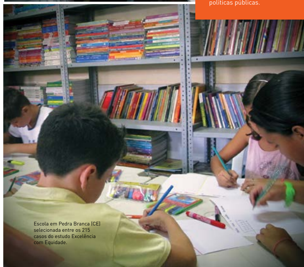
Escola em Pedra Branca (CE) selecionada entre os 215 casos do estudo Excelência com Equidade.

A segunda edição do seminário realizado em parceria com o Inspirare e o Instituto Península – já reconhecido como uma referência na agenda da educação – apresentou experiências concretas de inovações educacionais, nacionais e internacionais, da sala de aula às políticas públicas.